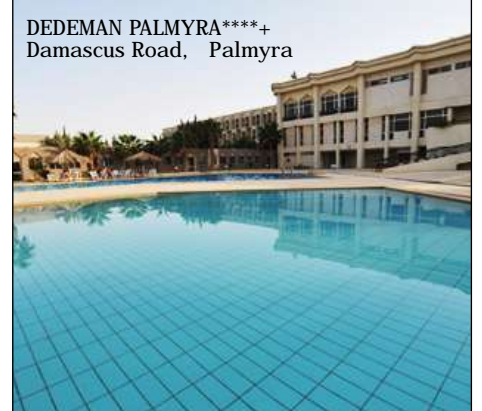
DEDEMAN PALMYRA****+ Damascus Road, Palmyra