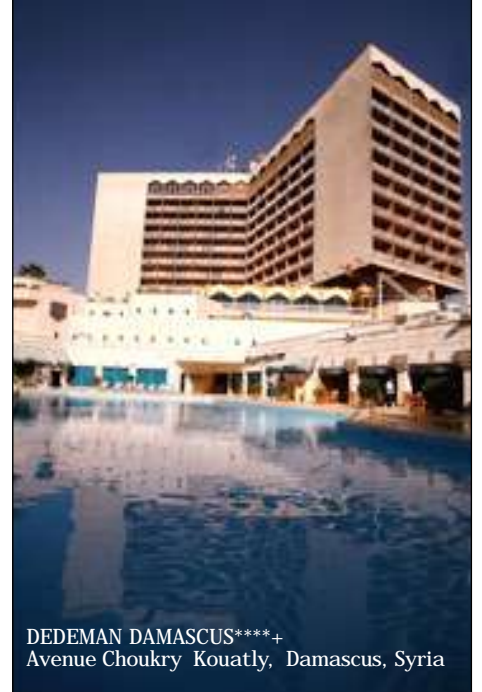
DEDEMAN DAMASCUS****+ Avenue Choukry Kouatly, Damascus, Syria