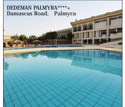
DEDEMAN PALMYRA****+ Damascus Road, Palmyra